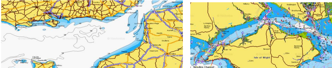
Uit Navionics chartviewer : links Het Kanaal en rechts The Solent

Een achtdaagse zeiltocht van Nieuwpoort naar het eiland Wight (The Solent, UK) op een HR 43. Inschepen op 21 mei 's ochtends in Nieuwpoort, zaterdag 28 mei ontschepen na de middag in Portsmouth (Gosport) *. Max. 3 deelnemers.